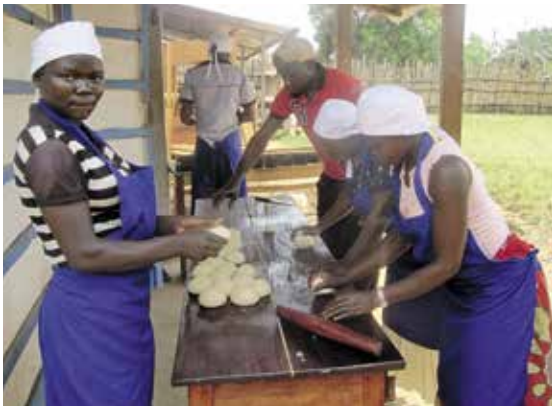
De kinderen leerden ook brood bakken in het centrum

Op sociaal vlak werd de kinderen gevraagd of ze zich verworpen of in de steek gelaten voelden door de gemeenschap. De meerderheid (84 procent) zei dat ze zich niet verstoten voelden. Dat staat in schril contrast met hun situatie voor hun opname in het centrum toen 98 procent aangaf zich verstoten te voelen. Velen waren voordien bedreigd door burens en dorpsgenoten, uitgescholden voor rebel en gediscrimineerd.