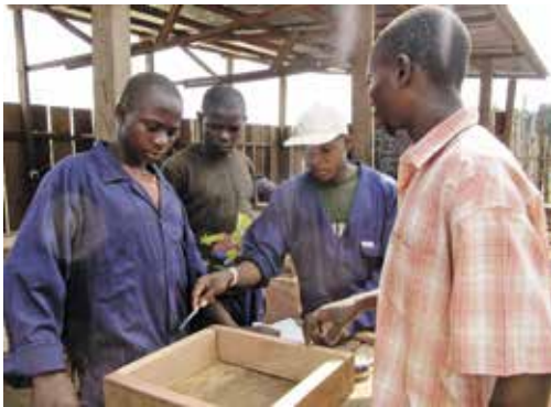
De schrijnwerkersklas in het Elikya centrum

Onder de 200 kinderen die werden opgevangen in het centrum waren er 83 weeskinderen, zestien kindmoeders (meisjes die met baby's waren teruggekeerd uit het rebellenleger) en dertien kinderen met een handicap.