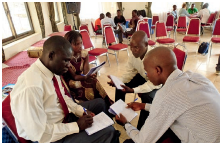
Intensief werken in kleine groepjes

Deze tweede trainingsweek werd begeleid door 2 erkende trainers (uit België en Nederland) in familietherapie, in samenwerking met 2 Oegandese psychologen. De totale trainingsduur zal 4 maal 1 week bedragen. Intervallen van minstens 6 weken tussen de verschillende trainingsweken, moeten de deelnemers de kans bieden de aangeleerde concepten en technieken in de praktijk toe te passen. Bovendien wordt elke deelnemer minstens 1 maal bezocht door een van de CCVS (residentiële) trainers tijdens dit interval voor het bespreken van individuele en persoonlijke moeilijkheden ondervonden tijdens het dagdagelijkse werk. Naar aanleiding van de training namen de deelnemers van de verschillende organisaties