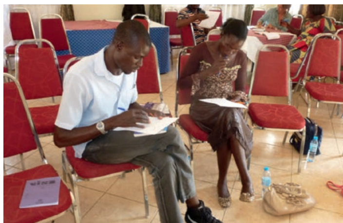
Nog meer werk ...