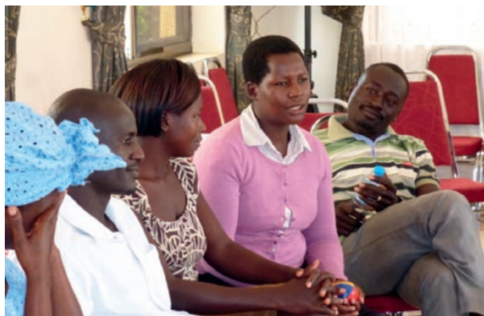
Luisteren naar elkaars ervaringen ...