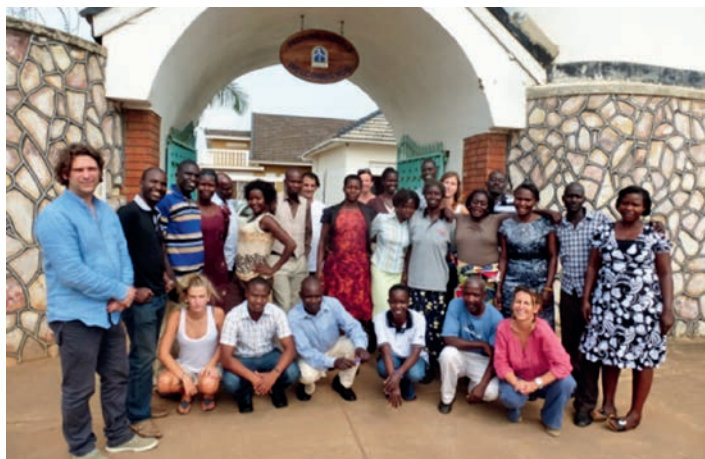
De groep deelnemers en trainers voor Hotel Pauline

Tussen maandag 10 en donderdag 13 juli organiseerde CCVS-Uganda voor de tweede keer een training in familietherapie voor 25 deelnemers. De training ging door in Pauline Hotel, gelegen net tegenover Rachele Comprehensive Secondary School – waar CCVS twee kantoorruimtes met SCU deelt. De deelnemers werden geselecteerd uit werknemers van organisaties en instituten die actief zijn binnen het domein van de psychosociale activiteiten. Het doel van de training is hen te helpen bij het verwerven van betere basisvaardigheden en gespreks- en behandelingstechnieken die hen kunnen helpen bij de psychologische steun aan en begeleiding van kinderen, jeugd, families, dorpen in Noord-Oeganda die tot vandaag de gevolgen dragen en verwerken van meer dan 20 jaar LRA aanwezigheid en gruweldaden.