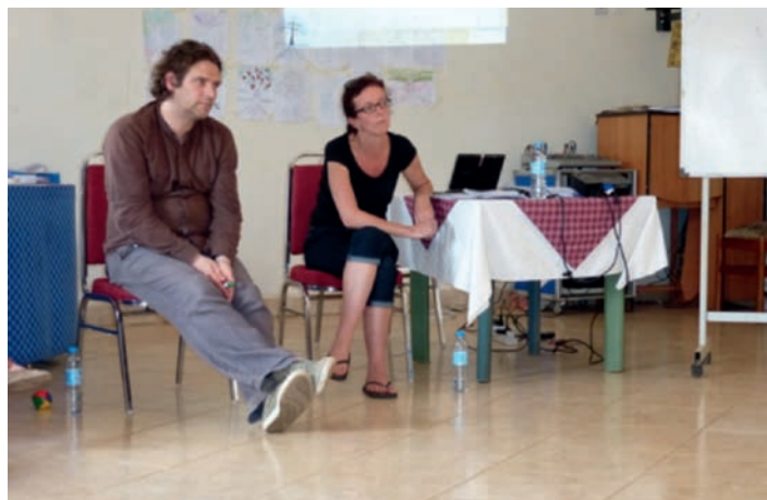
De trainers uit België en Nederland.